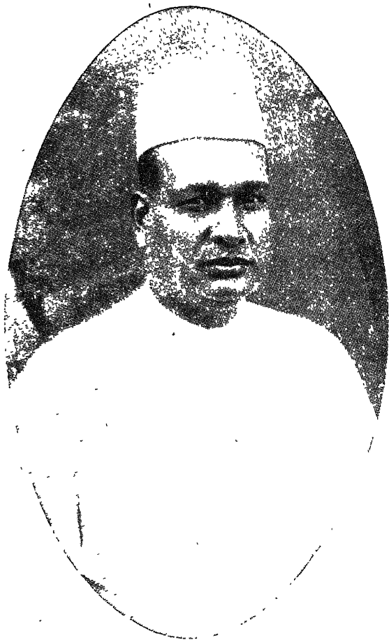
सेठ जमनालाल बजाज